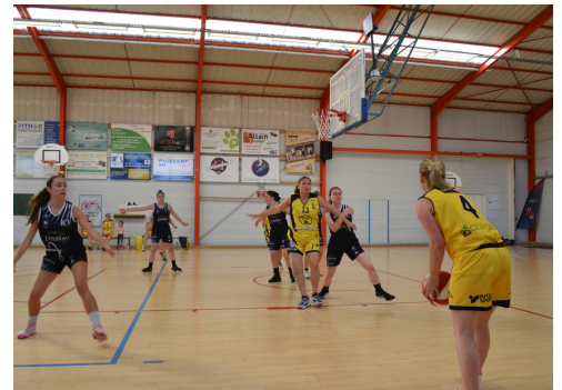
Les seniors F face aux premières du classement

Michel et Teddy ainsi que les joueurs de la Séniors M1 ont commencé la saison brièvement avec 1 défaite et 6 victoires. L'objectif du maintien est atteint, place à la poule haute... L'aventure de la coupe continue également, en 1/16e ils affronteront l'équipe de BEAUCOUZE 2 (Invaincu en DM3) dimanche 7 Janvier 15h30 à BEAUCOUZE.