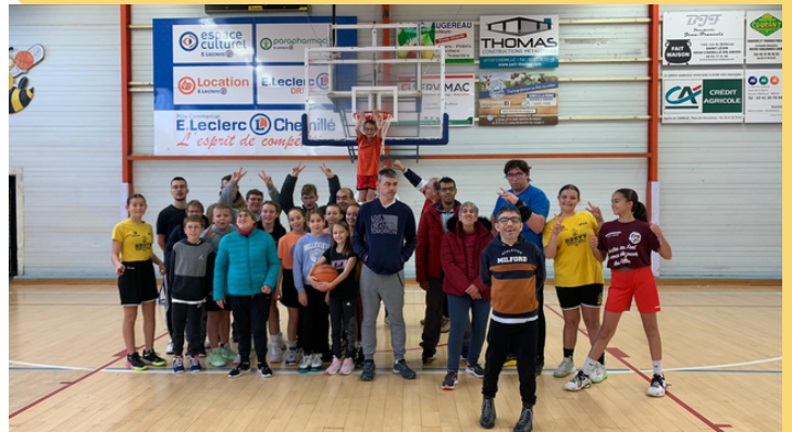
Résidents du GIBERTIN de Chemillé - accompagnés de nos licenciés

Le basket inclusif , c'est tout simple, il implique de faire en sorte que tout le monde, incluant les enfants et les personnes en situation d'handicap, à partager une séance de basket. C'est une pratique ludique sur le basket qui permet aux résidents de s'ouvrir à un monde extérieur et à nos licenciés de cultiver la tolérance, le tout dans la bienveillance.