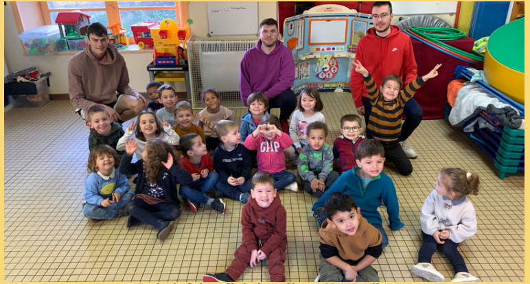
Ecole de Sainte Christine - Classe Maternelle

Jeudi 9 novembre, nos trois entraîneurs ont lancé la première séance de basket avec les élèves des classes de petites, moyennes et grande sections de l'école de Sainte Christine.