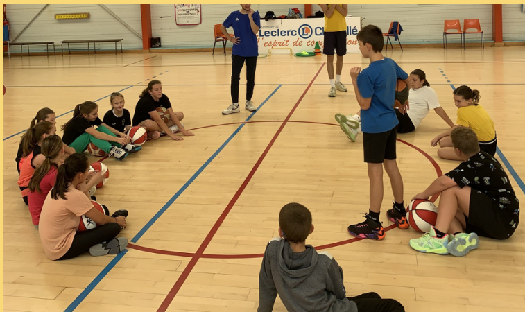
Animation des U13M et U13F

Pendant les vacances de la Toussaint, du 23 octobre au 3 novembre, nos entraîneurs ont proposé des animations afin de garder de l'attractivité dans le club et ont aussi convié gratuitement des enfants non-licenciés.