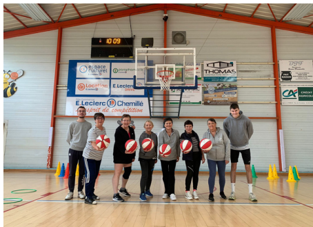
Animation découverte du 3 Novembre

Vendredis 3 et 10 novembre, nos éducateurs ont proposé une animation gratuite sport/basket santé, ils ont convié toutes les associations de Chemillé-en-Anjou. Ces animations ont été composées de divers petits jeux de mobilité et de dextérité avec ou sans ballons. Le tout dans la convivialité et le plaisir de chacun.