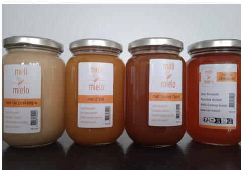
Nos différents miels

Le club vous propose de goûter le bon miel de notre partenaire Méli Mielo, il y en a pour tous les goûts... Miel de Printemps (Blanc et Crémeux) Miel d'Eté (Jaune et crémeux) Miel de toutes Fleurs (Légèrement acidulé) Miel de Châtaignier (Ambré et Liquide)