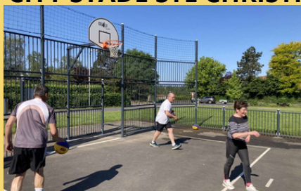
Animation Basket Santé

En cette fin de saison, nos entraîneurs se sont délocalisés au nouveau City Stade de Ste Christine, afin de promouvoir nos activités. Des non-licenciés ont pu découvrir le basket santé, le fit basket, ainsi que le basket 3x3. Si vous souhaitez découvrir vous aussi ces activités, il n'est pas trop tard, vous pouvez participer gratuitement aux séances jusqu'au 12 Juillet. Infos : as.neuivy.fr