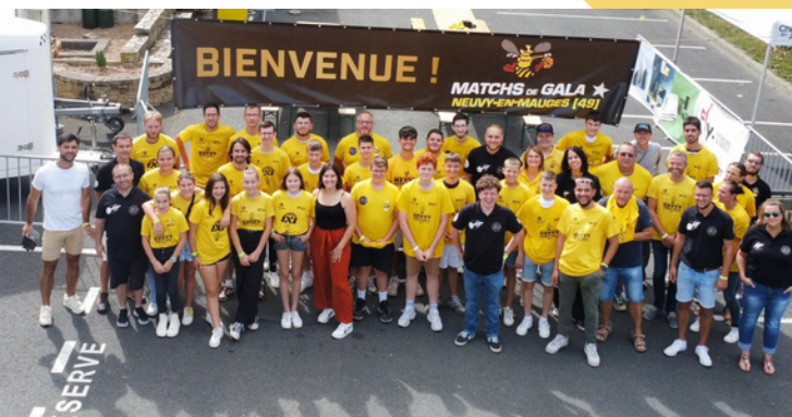
les bénévoles Matches de Gala 2023

L'équipe de Caen qui sera présente cette édition ont remporté la finale NM1, ils joueront en Pro B la saison prochaine.