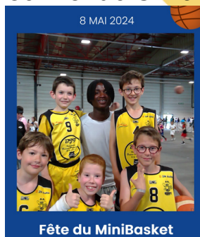
Fête du MiniBasket Notre équipe U11M

Comme chaque année, le 8 mai est synonyme de fête du MiniBasket au parc de la Meilleraie de Cholet, cette année près de 1500 enfants du département étaient présents parmi eux notre équipe U11M. Un tournoi très apprécié par nos jeunes pousses, ils ont pu croiser les joueurs pros de Cholet-Basket et même avoir quelques autographes.