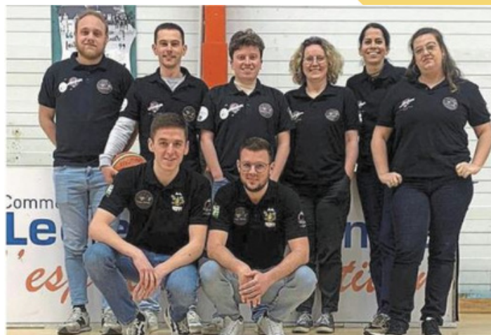
La Commission Matches de Gala - 2024

En attendant de vous retrouver, la commission Matches de Gala vous souhaite un bel été ! Allez l'Abeille !