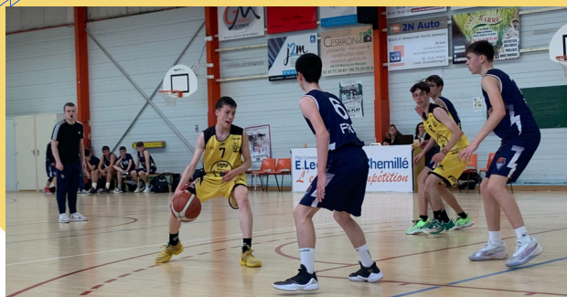
1/4 Neuvy contre Fuilletais Remigeois

Nos U17 affrontaient le Fuilletais Remigeois en quart de finale de challenge de l'Anjou. Le match est très serré pendant toute la première mi-temps mais malheureusement la deuxième mi-temps a été plus compliquée, nos joueurs on eu moins d'adresse, l'écart s'est creusé au fur et à mesure. Notre équipe ne fera pas de doublé. Le score final est sans appel 45 à 64, bravo à notre adversaire.