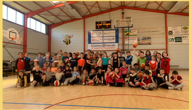
les élèves de Ste Christine et St Lézin

Afin clôturer au mieux les Opération Basket Ecole*, avec les écoles de Ste Christine et St Lézin, nos entraîneurs ont organisé, vendredi 19 avril , le 1er tournoi inter-écoles. Ils ont accueilli 60 élèves, ce tournoi fut une réussite, beaucoup d'enfants étaient satisfaits.