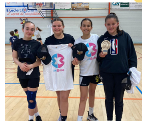
Equipe Vainqueur U13F

Samedi 27 avril , 15 équipes étaient présentes aux tournois 3x3, catégorie U13F et U13M et U17M.