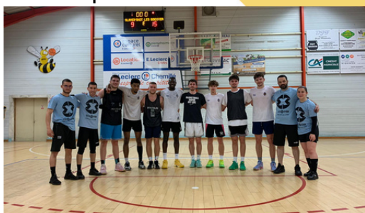
Les finalistes accompagnés des arbitres officiels

Vendredi 26 avril , le club a organisé le tournoi 3x3 Open Plus Access, qualificatif pour l'Open Plus de Nort-sur-Erdre) De très belles équipes, venant de toute la région et de la région parisienne, évoluant en championnat régional et national, sont venues se disputer le billet.