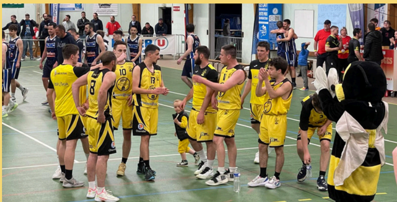
1/4 Neuvy contre Pomjeannais