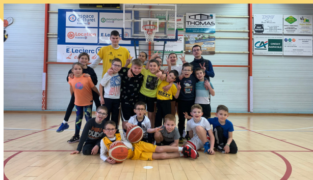
Animation Kinder Joy Of Moving

Mercredi 27 décembre a eu lieu la journée du Kinder Joy Of Moving, cette animation est réalisée en partenariat avec la fédération, le but étant de faire découvrir le basket, pour les catégories de U9, U11 et U13, licenciés et non licenciés étaient conviés gratuitement. Les 19 enfants présents ont pu participer à divers jeux et ateliers, chaque participant est reparti avec un petit livret sur les règles du basket.