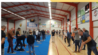
Participants du concours

Vendredi 8 décembre a eu lieu notre concours de palet, 36 équipes ont participé.