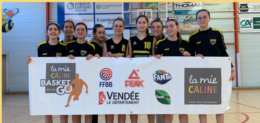
U15 F Entente USPP-NEUVY

En ce début de nouvelle année 2024, le bureau et la rédaction du journal vous souhaitent une très belle année 2024 ! Durant cette année 2024 plusieurs événements auront lieu : la traditionnelle Galette des rois, le dimanche 28 janvier , vous y êtes tous invités, le 1er Tournoi 3x3 "Coupe de France entreprise", vendredi 16 février , le Méga LOTO du club dimanche 3 mars et plein d'autres événements... Nous suivrons également nos Seniors M1, qui joueront l'accession en Pré-Région.