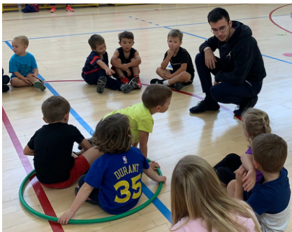
Groupe Micro-Basket - Ecole de la Basket 2023-2024