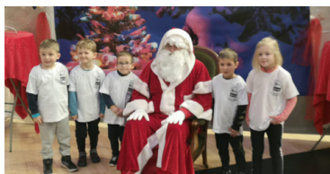
Animation du Père Noël du basket du Comité

Chaque année le comité départemental organise le père Noël du basket, cette animation a eu lieu le samedi 16 Décembre. Cette animation regroupe près de 590 enfants de 80 clubs. Nos U7 ont pu jouer sur différents ateliers et bien sûr rencontrer le père Noël.